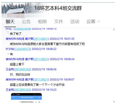
及时的与学生沟通

为保障开学第一课的顺利，19号就开始积极的组织学生加入课程交流群，与学生交流，教学生如何去登录和使用网络教学平台，模拟上课、课堂互动和作业提交批改，与同事交流经验，用她的行动抗击疫情，尽自己最大的努力来让学生适应线教学。