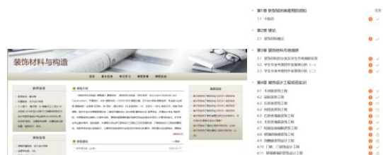
多平台的资料准备

为保障开学第一课的顺利，19号就开始积极的组织学生加入课程交流群，与学生交流，教学生如何去登录和使用网络教学平台，模拟上课、课堂互动和作业提交批改，与同事交流经验，用她的行动抗击疫情，尽自己最大的努力来让学生适应线教学。